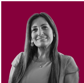
Trunfio Wanda IC "Nicolò Barabino" Genova