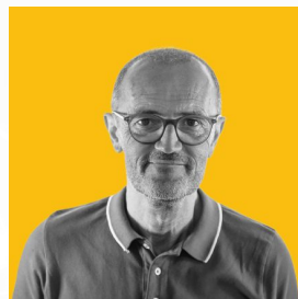
Alluto Giulio Liceo "O. Grassi" Savona