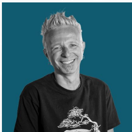
Gualdi Loris Fondazione CIF Genova